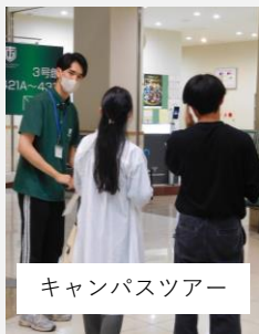
キャンパスツアー

当日は大学生活に関する心配ごとや質問にも先輩たちが答えます！ 授業や研究で使用する、スポーツ専用施設を解説します！