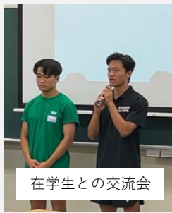
在学生との交流会